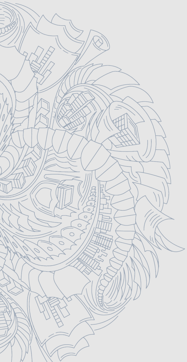
Illustration: Protecting client interests by Sam Hadley